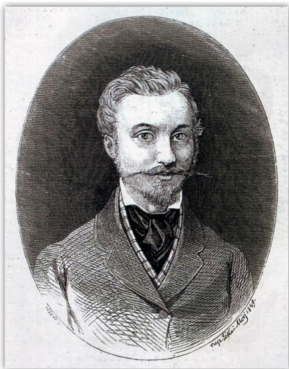
8. ábra. Ásvai Jókay Móric: Jókai Mór önarcképe

ébredve, hírt mondhasson rólok. [...] beszívásnál az altató illanynak már érzeni az izgató mámort, [...] később minden külsőbb érzék elhal, hanem még az öntudat megmarad, [...] majd elvész az öntudat is, az ember megszűnik saját testéről érezni... Nem bódít, az idegeket nem tompítja el, és semmi rossz utóérzetet nem hagy maga után.” 7