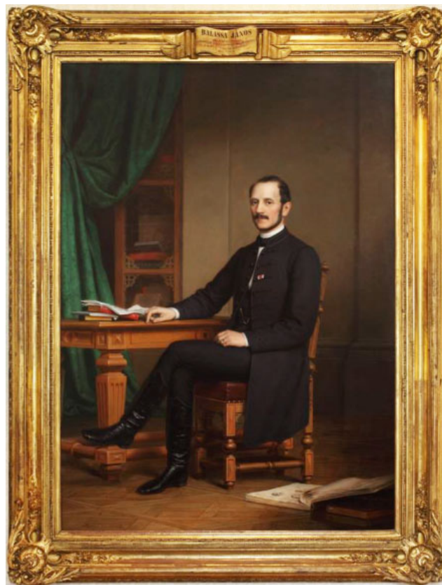
6. ábra. Barabás Miklós: Balassa János sebészprofesszor