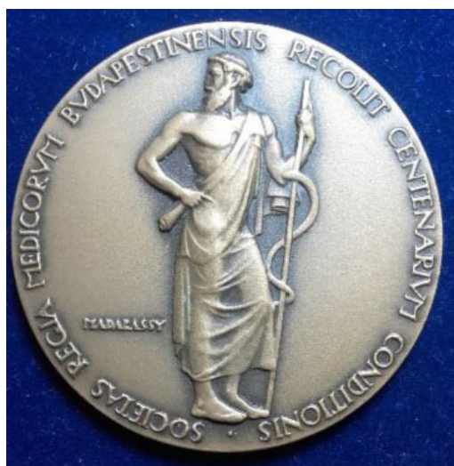
1. ábra. A Balassa-érem 1905–1943

Balassa János (2. ábra) 1814. május 5-én született Sárszentlőrincen, és mindössze 54 évesen, 1868. december 9-én halt meg Pesten. Középiskoláit a sárszentlőrinci egyházmegyei gimnázium után a soproni és pozsonyi evangélikus liceumokban végezte kitűnő eredménnyel. Orvosi tanulmányait 18 éves korában kezdte meg Pesten,