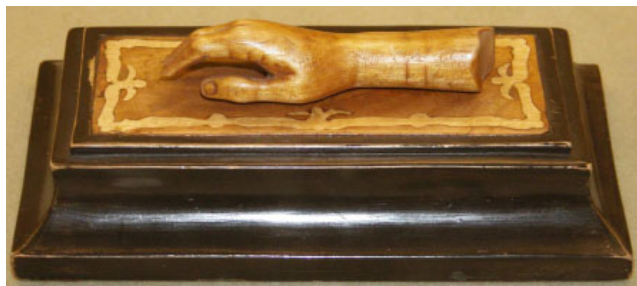
7. ábra. Balassa János keze. Deák Ferenc faragása

Balassa működése gyakorlatilag a teljes magyar sebészi, de szélesebb értelemben a teljes orvosi szemléletet megújította. Nézzünk erre néhány példát. Orvostudományként eltörölte a hároméves sebészképzést, elősegítve ezzel a sebészet be- és felemelését a tudományosan alapozott orvosi szakmák közé. Felismerte, hogy „Aki a beteg életszabályait akarja kutatni, szükséges, hogy az ép és az egészséges törvényeit alaposan ismerje, mert hiába erőlködik a részek tüneményeit megérteni az, aki előtt sötét az egészséges valója...”. Erre alapozva jelentette ki: „A sebészet és belgyógyászat ugyanazon tudományos alapon áll. [...] Ne legyen a sebészet egyedül külformákon alapuló kézmű, hanem az egészet egyes részeiben feltaláló tudomány.” Világosan látta azt is, hogy a tudomány határokon