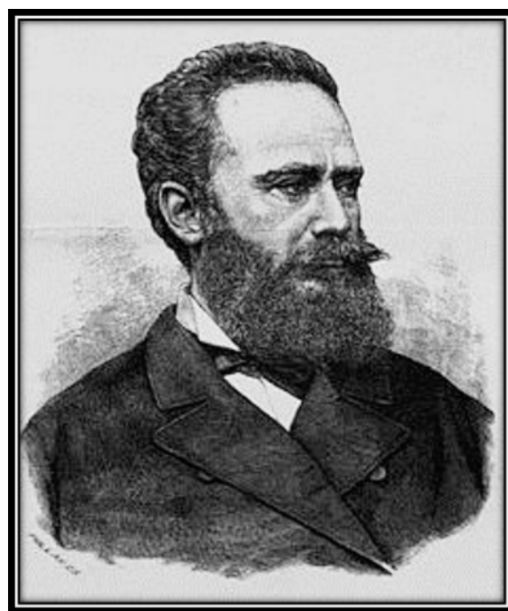
4. ábra. Balogh Kálmán (1835–1888); „mind közül a legműveltebb”