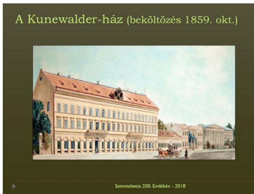
3. ábra. A Kunewalder-ház

Egyesek szerint ez az esemény volt a döntő momentum a kinevezésben, ám a császári aláírás megszületése mégis sokkal inkább egy piros esernyő meglétén múlhatott. Az amúgy 5 nyelven beszélő, kiváló zenei és botanikus tehetséggel rendelkező, csupán uralkodásra teljességgel alkalmatlan V. Ferdinánd kedvelt időtöltése volt ugyanis, hogy rendszeresen tett bécsi utcai sétákat egy – a feje fölött időjárástól függetlenül mindig nyitva tartott – élénkpiros esernyővel. Hiteles feljegyzések szerint Metternich kancellár ezeket a sétákat a császárhoz méltatlannak ítélte, ezért az esernyőt rendszeresen eldugta az uralkodó elől. Ferdinánd viszont ilyenkor hivatali időben hisztériásan verte az asztalt, hogy addig nem ír alá semmit, amíg a piros esernyő elő nem kerül. 3 Nos, a kinevezés végül aláíratott a visszakapott paraplé birtokában, aminek hírére Balassa azonnal felcseréli a szakmai világszínvonalat a minden tekintetben sze-