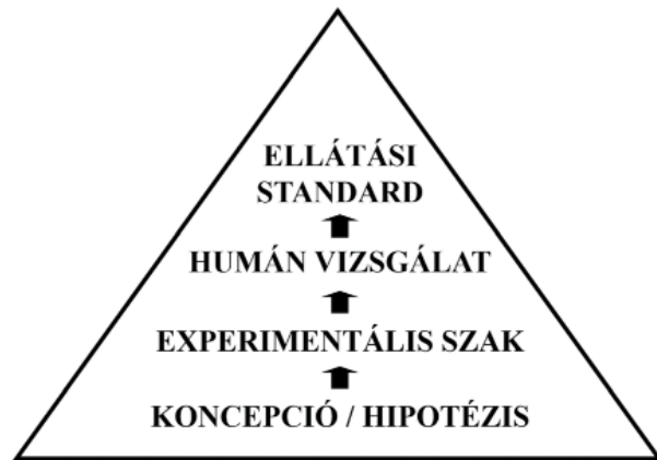
11. ábra. Az EBM innovációs piramis

lis körülmények között kell bizonyítani, majd ezután következnek a humán vizsgálatok, először egészségeseken, később betegeken. Ez a séma a kliniko-farmakológiából jól ismert, át nem hágható követelményrendszere az innovációknak. Ráadásul alapkövetelmény, hogy az innovatív eljárás legyen hatásos, legyen jobb (vagy legalább nem rosszabb), mint a hagyományos, legyen biztonságos, költséghatékony.