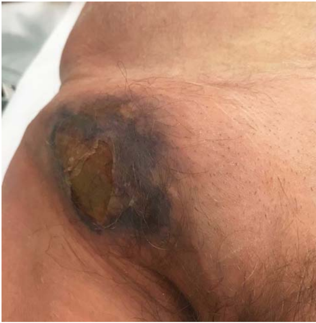
2. ábra. II. eset: Kizárt femoralis hernia, inguino-femorális nekrozis