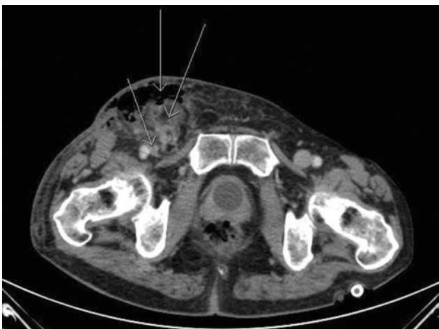
3. ábra. II. eset: Kizárt femoralis hernia. Nyilak balról jobbra: komprimált v. femoralis, subcutan emphysema, appendix