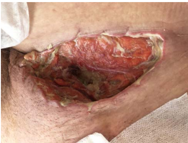
4. ábra. II. eset: Necrectomia utáni állapot

dian laparotomiából lege artis appendectomiát végeztünk. A hasüreg zárása után, femoralis hernioplasticát és a subcutan nekrozis kimetszését végeztük, a sebet ezt követően nyitva kezeltük (4. ábra). A posztoperatív szakban egy napig intenzív megfigyelést igényelt, majd ezt követően pulmonológián folytatódott kezelése, ahol az 5. posztoperatív napon jelentkező passzázszavar miatt CT-vizsgálatot végeztek. A CT vékonybél ileust és hasfali sebszétválást ábrázolt. Sürgősséggel reoperáltuk, mely során adhaesiolyist és hasfali resuturát végeztünk. Ezt követően szövödménye nem jelentkezett, jobb oldali inguino-femorális sebén negatív nyomásos sebkezelést (NPWT: negative pressure wound therapy) alkalmaztunk, majd szekunder suturát végeztünk. Emissziójára az első műtétet követően 22 nappal került sor, további ambuláns sebészeti kontrollokon nem jelent meg. Szövettani vizsgálata alapján az appendix low grade mucinosus neoplasiájára derült fény, illetve a mikro- és makroszkópos vizsgálat alapján a műtét során talált abscessust a specimentől függetlenül írták le, appendixperforációra utaló jelet nem találtak. A reszekció az épbén történt, illetve nem merült fel intraoperatív mucin disszemináció, így további műtéti beavatkozást a tumor ellenére nem tartottunk szükségesnek. A szövettanra tekintettel kért onkológiai konzílium a komplex képalkotó kivizsgálást követően további onkológiai kezelést nem indikált.