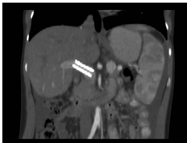
3. ábra | Kontroll-CT-vizsgálat coronalis síkú rekonstrukcióján látható a jól expandált stent a vena portae-ban

gével elkerülhetők a nagyobb erek, a pulzus, és színes Doppler használatával elkülöníthetők és megóvhatók az artériák is.