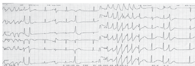
3. ábra | Monitorozás során észlelt rövid kamrai tachycardia