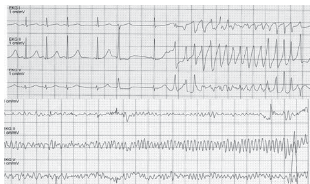
4. ábra | „Torsades de pointes” kamrai tachycardia, majd kamrafiibrilláció