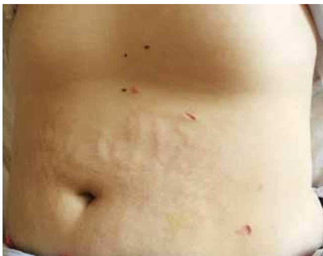
2. ábra | A kozmetikai eredmény 4 héttel a műtét után

Egyes szerzők a recidíva elkerülésére a köldök kiirtását is szükségesnek tartják [17], mások a hólyag részleges reszekcióját vélik indokoltnak az esetleges malignus átalakulás megelőzésére [18].