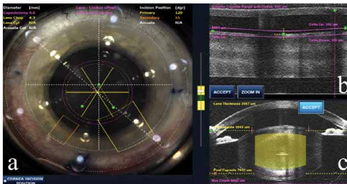
2. ábra | A megújult vezérlőszoftver kezelőfelülete. A dokkolás után a szemről nyert nagytáblás képen a sebész beállítja a capsulotomia, lencsefragmentálás és cornealis sebek pontos helyét (a), a nagy felbontású OCT-felvételeken pedig rögzíti a capsulotomia (b) és a lencsefragmentáció (c) kezelési és biztonsági zónáit, valamint megtervezi a cornealis sebeket