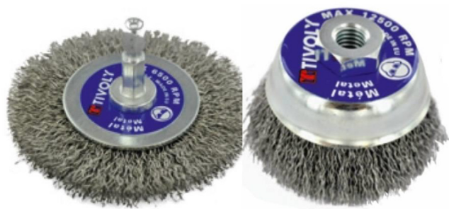
3. ábra | Forgó drótkéfe feje

Zárt szembetegség miatt 4 alkalommal történt műtéti ellátás. Egy esetben intramuralis idegen test miatt történt pars plana vitrectomia az idegen test eltávolítása után ora serrata szakadás miatt. Egy esetben a tompa sérülés során a szemlencse az üvegtestbe süllyedt, ami miatt az első lépésben annak eltávolítása történt, a második lépésben pedig tervezetten iris-clip lencse implantációját végeztük. A harmadik esetünknel a szemlencse sublúxiója miatt ICCE-műtét, majd iris-clip lencse implantációja történt. Negyedik esetünknel műlencse-subluxatio, majd traumás maculalyuk kialakulása miatt 4 alkalommal történt beavatkozás.