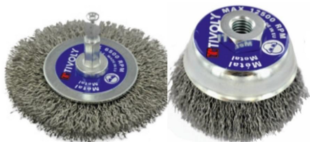
3. ábra | Forgó drótkéfe feje

Zárt szembetegség miatt 4 alkalommal történt műtéti ellátás. Egy esetben intramuralis idegen test miatt történt pars plana vitrectomia az idegen test eltávolítása után ora serrata szakadás miatt. Egy esetben a tompa sérülés során a szemlencse az üvegtestbe süllyedt, ami miatt az első lépésben annak eltávolítása történt, a második lépésben pedig tervezetten iris-clip lencse implantációját végeztük. A harmadik esetünknel a szemlencse sublúxiója miatt ICCE-műtét, majd iris-clip lencse implantációja történt. Negyedik esetünknel műlencse-subluxatio, majd traumás maculalyuk kialakulása miatt 4 alkalommal történt beavatkozás.