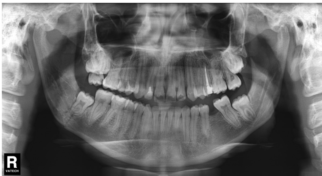
3. ábra | A panoráma-röntgenfelvételen jobb oldali angulustörés látható kétoldali occlusióval támasztott és bölcsességfog jelenlétével asszociáltnak

Világszerte az egyik leggyakrabban elvégzett szájsebészeti beavatkozás az impaktált alsó bölcsességfogak eltávolítása [47, 48]. A tünetmentes, egészséges, előtöré-