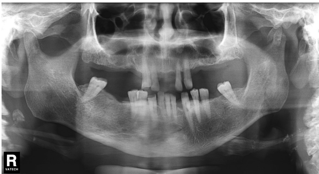
4. ábra | A panorámia-röntgenfelvételen bal oldali condylustörés látható 'cask front' területi occlusió érintkezéssel és ipsilateralis bölcsességfoghiány asz-szociálisan

sében visszamaradt alsó bölcsességfogak profilaktikus eltávolításának oka a potenciálisan kifejlődő patológiás elváltozások megelőzése lehet [31]. Antic és mtsai nem javasolják az angulustörés megelőzése céljából az impaktált alsó bölcsességfogak eltávolítását [49]. Iida és mtsai szerint fiatal sportolók alsó bölcsességfogainak eltávolítása csökkenti az angulustörés, ugyanakkor fokozza a condylustörés kockázatát, ami a mandibulatórések közül súlyosabb szövődeményekkel járhat [18]. További vizsgálatok szintén kimutatták, hogy a bölcsességfogak profilaktikus eltávolítása az angulus régió posztoperatív megerősödését eredményezi, így fokozva a komolyabb lehetséges szövődeményekkel járó condylustörés kockázatát [20, 29, 42]. Van, aki kritikával illeti a profilaktikus bölcsességfog-eltávolításnak a fentiekben leírt relatív kontraindikációját [33]. Vizsgálatunkban a bölcsességfoghiány szignifikánsan összefüggött a condylustörésekkel (4. ábra). Ez megegyezik számos korábbi kutatás eredményével [12, 17, 20, 40, 43]. Az idegsérülés szempontjából magas rizikójú bölcsességfog-eltávolítás alternatívája lehet a coronectomia elvégzése [50]. Egyelőre nincs releváns szakirodalmi adat, hogy a coronectomia kivitelezése hogyan befolyásolja a mandibula törésmintázatát.