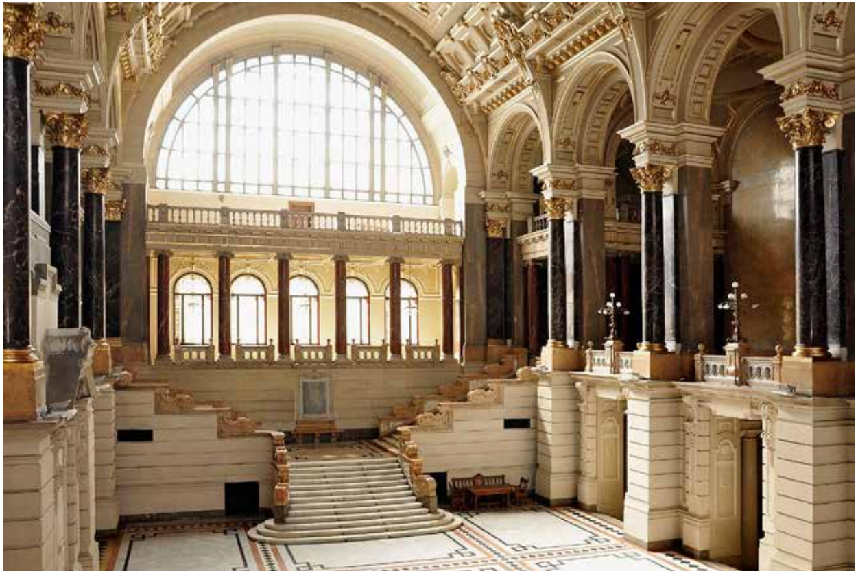
1. Budapest, Igazságügyi palota, központi csarnok. Hauszmann Alajos, 1893–1896

nagyterme méreteivel és akusztikájával a későbbi látogatókat is lenyűgözte, olyan építészeti térként tekintettek rá, amely méltó módon tükrözi a törvényszék hatalmát és szimbolikus jelentőségét. 8 A terem egykori látványát Jacques Androuet Du Cerceau 1576–1580 körül rézmetszeten örökítette meg, és ráadásul még föl is nagyította az arányait. Mivel ez az ábrázolás a 19. században Charles Méryon 1855-ben közreadott rézkarca révén 9 szélesebb körben is ismertté vált, nagyban befolyásolhatta az újonnan épülő, hasonló rendeltetésű csarnokokkal kapcsolatos képzeteket és elvárásokat. Az 1776-ban és 1871-ben, tűzvész során megromlódott teret Louis Duc és Théodore Dommey tervei szerint 10 újjították meg, úgy, hogy megtartották középkori eredetű, kéthajós elrendezését, de súlyos dongaboltozattal fedték, neoreneszánsz jellegű oszloprendes árkáddal tagolták, termaablakokat nyitottak a végfalain. A 19. században épített igazságügyi paloták tervezésekor főként Franciaországban és Belgiumban vitték tovább ezt a térformát, és az újonnan épített csarnokokban rendre hasonló szerkezetekkel és motívumokkal találkozhatunk. Jan-Lodewijk Baeckelmans és Frans Baeckelmans tervei alapján 1871–1874 között neoreneszánsz stílusban épült fel az antwerpeni Oud Gerechtshof Britselei a két nagy udvart körülvevő