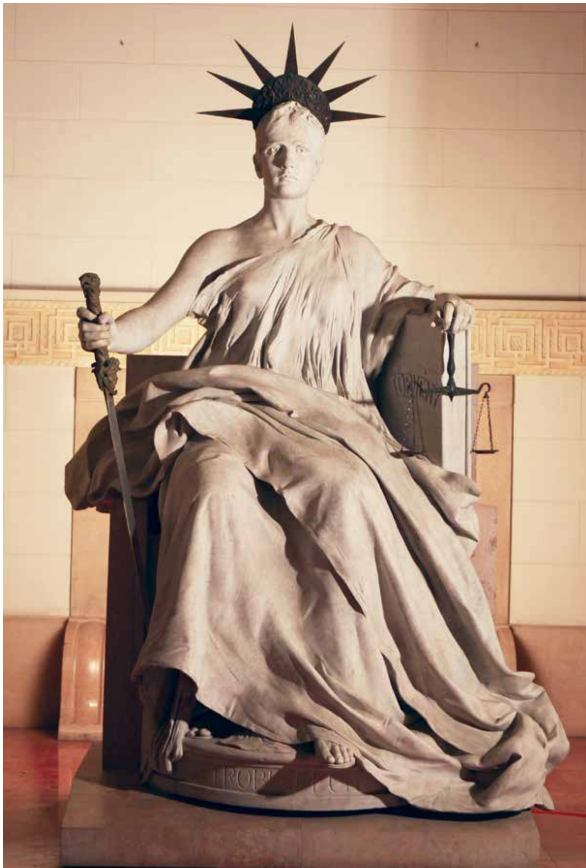
3. Stróbl Alajos: Justitia , 1896. Mai őrzési helye: Budapest, Legfelsőbb Bíróság, aula