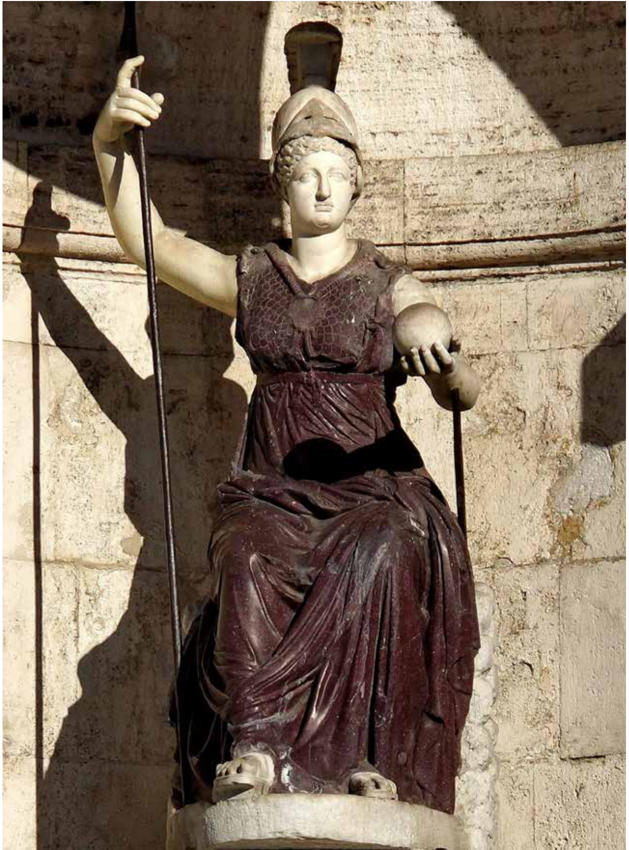
5. Dea Roma, 3. századi Minerva-szoborból átalakítva, 1589. Róma, Piazza del Campidoglio