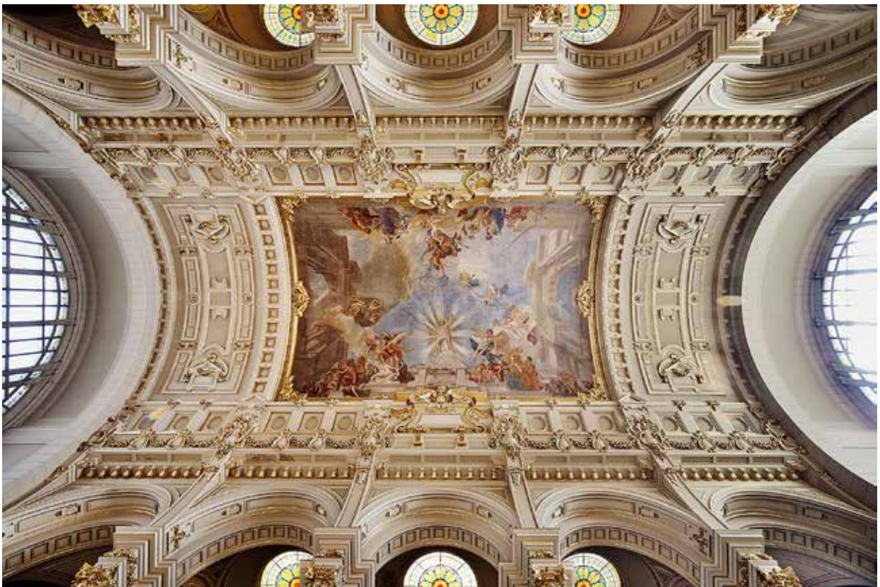
9. Budapest, Igazságügyi palota, a központi csarnok boltozata Lotz Károly Justitia diadala című mennyezetképével, 1895