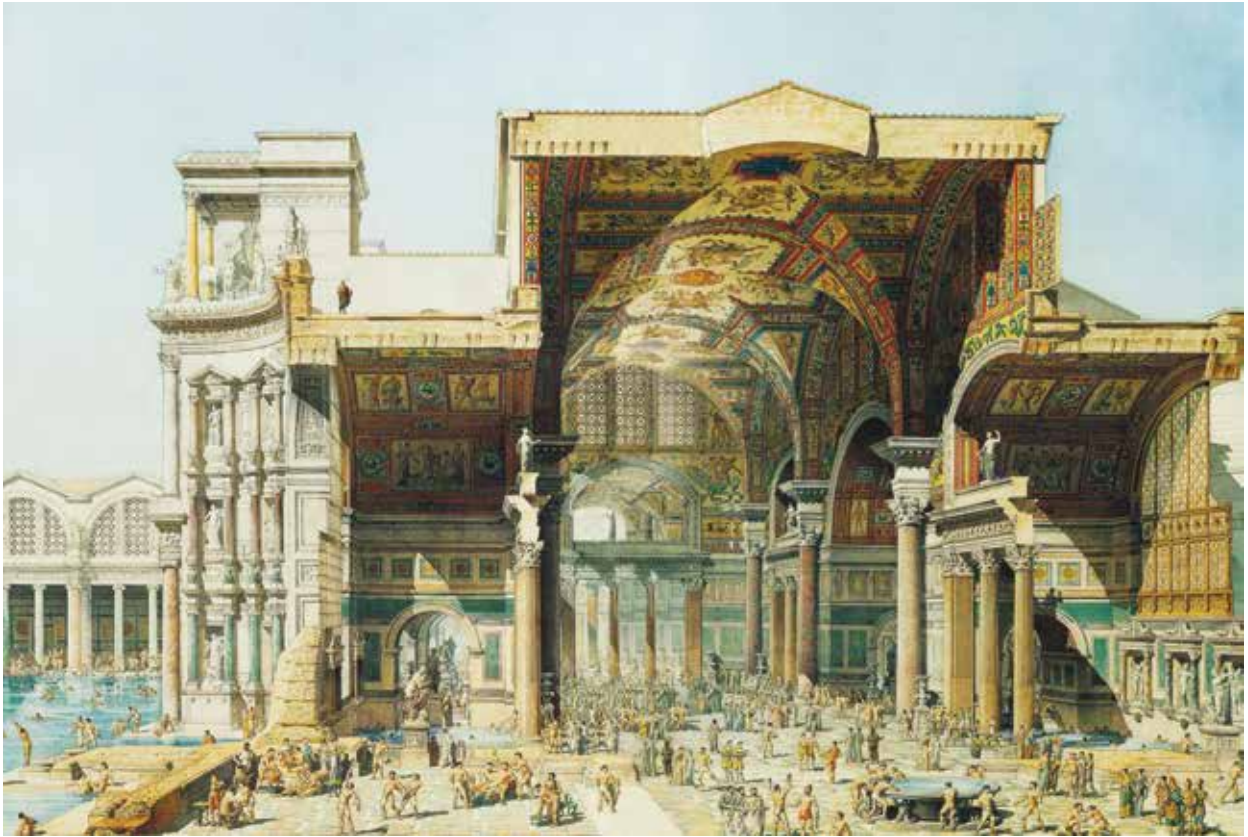
8. Edmond Paulin: Diocletianus termáinak rekonstrukciója, 1890