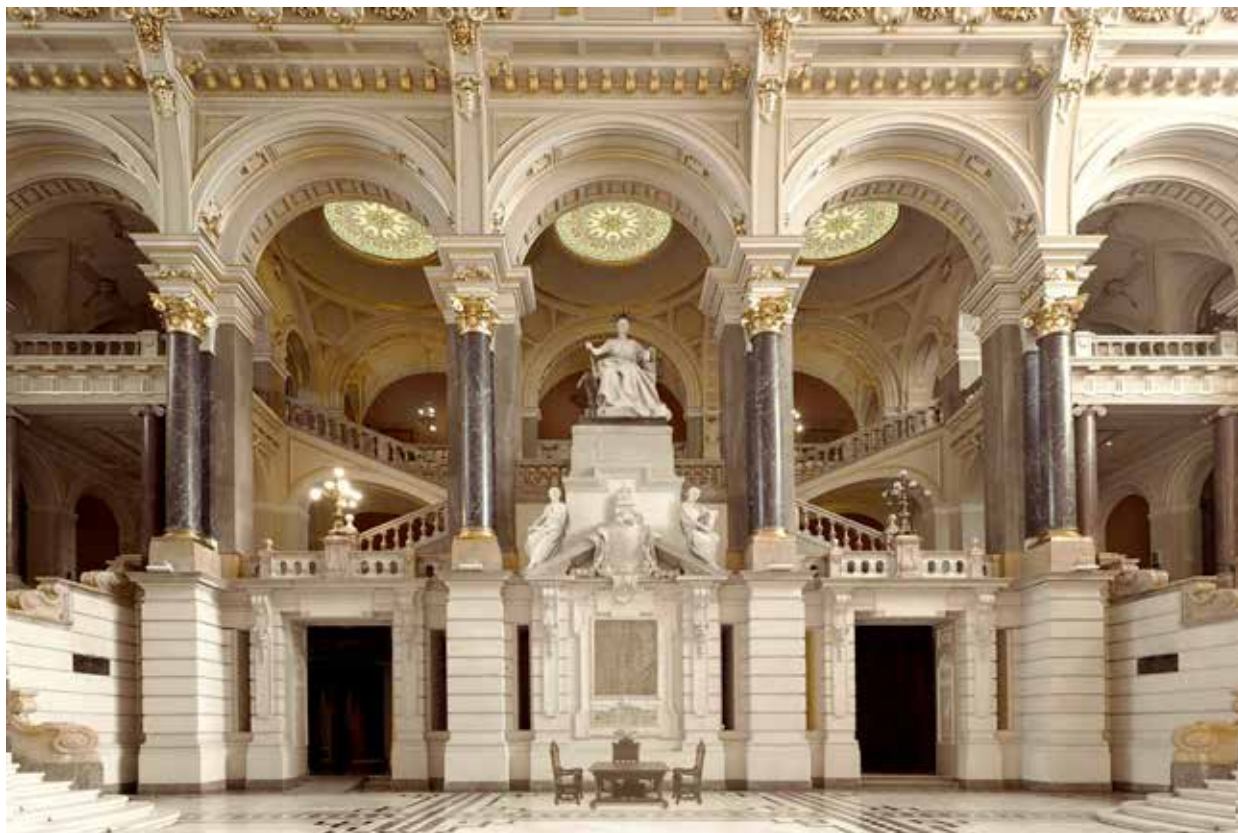
6. Budapest, Igazságügyi palota, központi csarnok Stróbl Alajos Justitia-szobrával. Számítógépes rekonstrukció

ügyi palotában a térrészeket összekapcsoló lépcsők és korlátok vonalainak olyan túlradó játékaival találkozhatunk, amihez hasonlót a barokk is inkább csak külső terekben, a kertépítészetben valósított meg (pl. Collodi di Pescia, Villa Garzoni, 1650 k., illetve 1771–1786). Hauszmann a maga térkompozíciójával persze a kortárs historizmus lépcsőterekkel egybenyitott csarnokaival is versengett, amely ezen a téren gyakran pazar és meghökkenítő megoldásokkal állt elő, elég a müncheni Justizpalast központi csarnokának néhány évvel korábban (1891–1897) Friedrich von Thiersch által megtervezett, ugyancsak a barokk lépcsőkompozíciók világából kiinduló architektúrájára utalni. 16