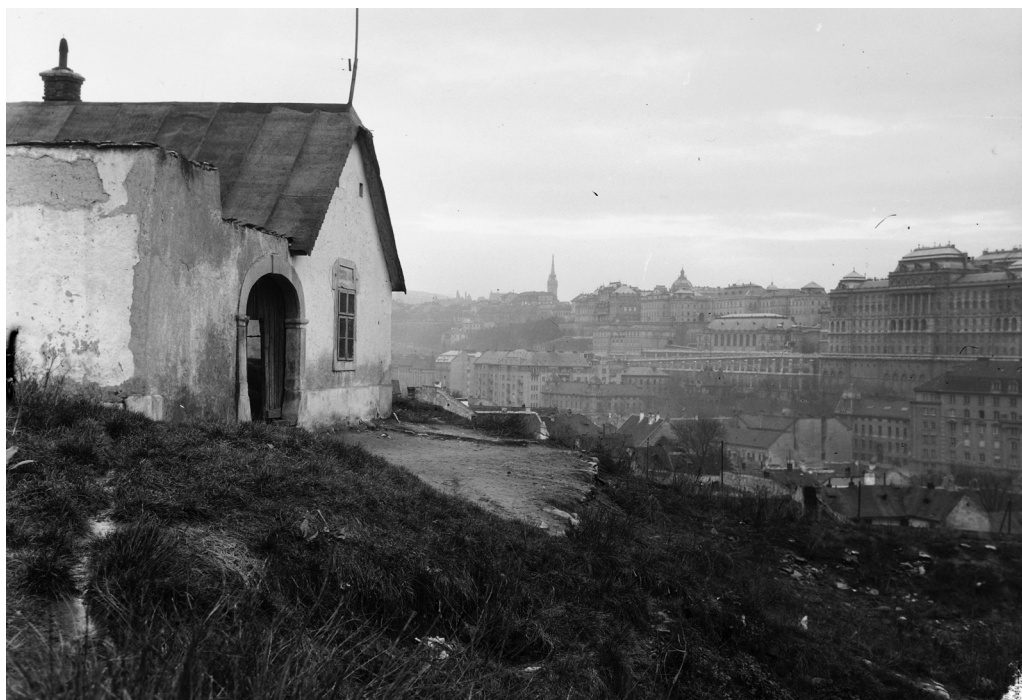
1. ábra. A budai vár a Tabán felől 1929-ben

A budai vár történelmi helyzete nyomán évszázadok óta központi szerepet játszott; fejlesztésében-építésében a reprezentativitás időről időre meghatározó tényező volt. Az uralkodói székhely mellett a polgárváros területére a barokk korszaktól már jelentősebb számban épültek paloták is. 2 A kiegyezés utáni új politikai berendezkedés és a gazdasági konjunktúra indikálta a városeyesítést, és erősítette azt a régi igényt, hogy Budapest valódi fővárossá váljon intézményeivel és építészeti megjelenésében is. A dualizmus kori nagy városfejlesztési akciók – mint például a Sugárút vagy a Parlament környékének alakítása – ugyan a maguk korában is kaptak kritikát akár urbanisztikai vonatkozásban, akár az egyes épületek tekintetében, mégis irányadóak voltak. A szabályozás által engedett kereteket kitöltve, igen nagy méretben, architektúrájukban jellemzően a historizáló ízlést követve valósultak meg. A szaklapok tervismertetői, híradásai is a látványos, nagyméretű és költségű beruházásokról szóltak zömükben. Az építészeti diskur-