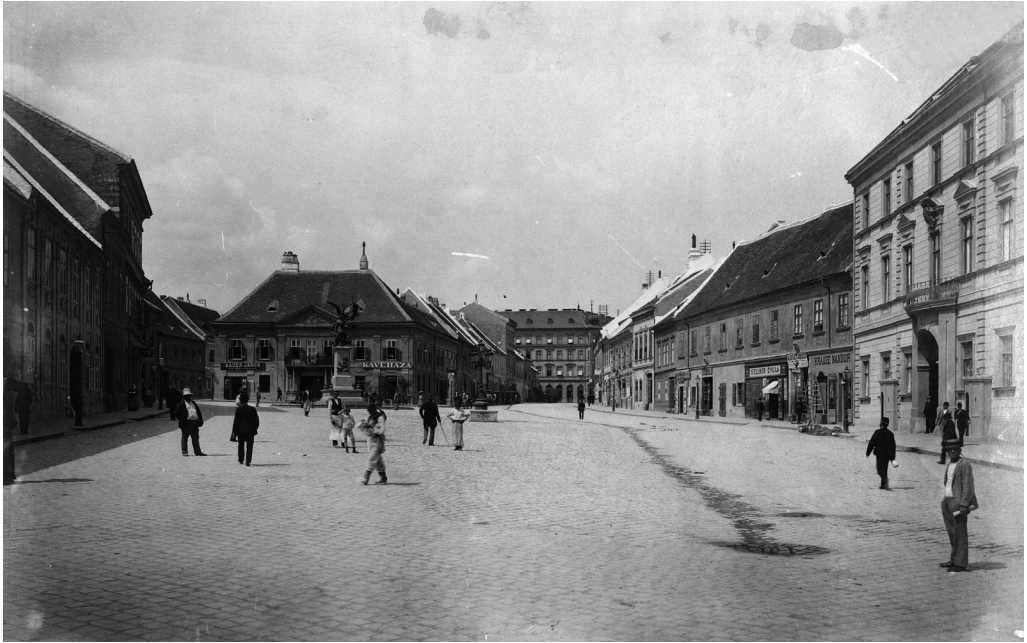
7. ábra. A Dísz tér északi oldala 1893 körül