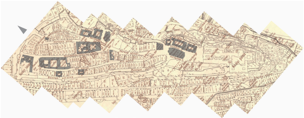
4. ábra. Intézmények, középületek a budai városban 1908-ban

adva a vári látképnek. A kiegyezés környékén még feltűnően magas a katonai létesítmények – ezek közül is a laktanyák – száma. Ez a politikai konszolidációval összhangban csökkent, a Nádor laktanya őrizte csak meg ezt a funkciót. A hadügyi igazgatás azonban egyre több szervvel és épülettel volt jelen. Ezek közül a Honvédfőparancsnokság és a Honvédelmi Minisztérium az első olyan országos hatókörű intézmények voltak, melyek új palotát kaptak, a hagyományosan itt székelő Pénzügyminisztérium új épülete is elkészült a századfordulón. 1916-ra a saját célra épített palotával rendelkező minisztériumok mellett még három működött – legalább részben – a polgárvárosban, további országos, fővárosi és kerületi hatókörű hivatalok mellett (3–5. ábra).