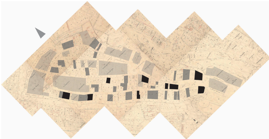
6. ábra. Magasságukban léptékváltást képviselő lakóépületek (fekete), nagyobb lakóépületépítések (szürke) és intézmények (világosszürke) a dualizmus korában a polgárvárosban

A polgárvárosi lakóházépítések 9 terén már a kiegyezés előtt, a klasszicizmus és romantika időszakában tapasztalható a házak méretnövekedése a hagyományos kétszintes utcaképekben. Látványos példa erre a Tárnok utca 12., Űri utca 11. szám alatti, átmenő telekre készült, Hild