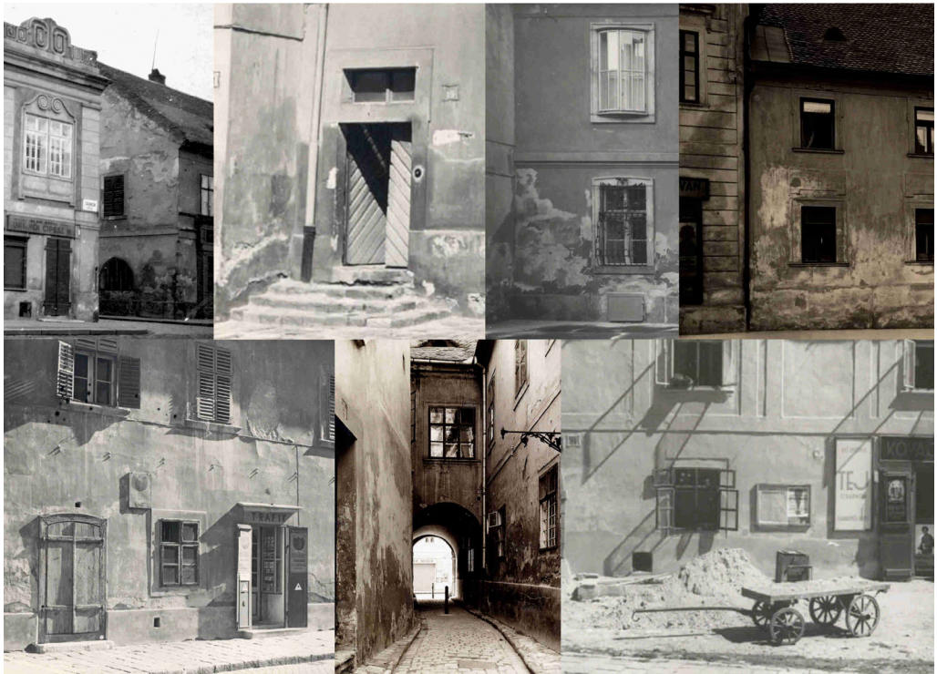
2. ábra. Elhanyagolt részletek a polgárvárosban (Összeállította: Maróty Katalin)

Ha a polgárváros képét tekintjük és az archív fotókon – a legkorábbi fényképfelvételektől egészen a II. világháborúig – az apró részletekre koncentrálunk, akkor meglepetéssel tapasztaljuk, hogy mennyi helyen omlott a vakolat, ázott a lábazat, pattogzott a festék (2. ábra). Óhatatlanul felvetődik a kérdés, hogy miért nem vigyáztak a történeti értékekre egy olyan korszakban, amikor maga az architektúra is a történetiséghez kötődött? Egyrészt emlékezetünkbe kell idéznünk azt a közismert tényt, hogy az egyes objektumok számos régebbi műrészlete csak a II. világháború pusztításai nyomán vált láthatóvá és ismertté. A vári lakóépületek közül igen sok leginkább jellegtelennek tűnt korszakunkban. Másrészt mindenképpen figyelembe kell vennünk, hogy a korszak műemlékvédelme a 20. század második feléhez képest nagyon eltérő helyzetben volt. Az inventarizáció a kezdeteknél tartott, az első országos jegyzék 1906-ra készült el. 3 A helyreállítások szemléletében a purizmust lassan váltotta fel a különböző időszakokat egyaránt értékelő tervezés, ráadásul – hiszen a kezdetekről beszélünk – a beavatkozások a legfontosabb nagy