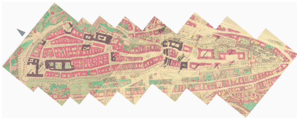
3. ábra. Intézmények, középületek a budai várban a kiegyezés környékén

A polgárvárosi építkezések értelmezéséhez egy további tényezőt is figyelembe kell vennünk; a helyszínen működő különböző intézményeket és a középületeket. A szakrális épületek köre korszakunkban szinte változatlan, a középkori Mária Magdolna-templom – melyet ekkoriban Gránát- és Helyőrségi néven emlegettek – mellett a korabeli műemlékvédelem témaköre kapcsán felmerülő Mátyás-templom szolgálta a római katolikusokat. Az evangélikus gyülekezet a 19. század közepén a Dísz téren építette fel templomát, amit az igazgatási épületek „szorítottak ki” és a millennium előtt egy évvel készült el Kallina Mór tervei szerint a Bécsi Kapunál az új épület. 5 Az egyházak működéséhez kötődően korszakunk végén hadiárvházakat is létesítettek. A dualizmus alatt végig a polgárvárosban működött az Egyetemi és az Állami Nyomda folyamatosan bővülő területen, a fejlődő technológiák miatt magas kéményekkel némi ipari jelleget is