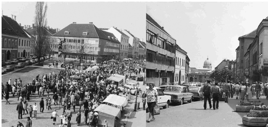
9. ábra. A Dózsa tér északi és déli oldala az 1980-as évek elején