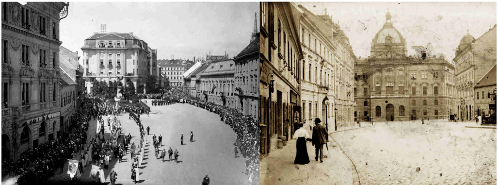
8. ábra. A Dísz tér északi és déli oldala az új épületekkel

A budai vár dualizmus korában átadott léptékváltó épületei – mind az intézményi irodaházak, mind a bérházak – későbbi sorsukban is osztoztak. A II. világháborús pusztítások után jó részük maradványait is eltakarították, az állva maradt épületek felső szintjeit lebontották. Ezeknél a homlokzati architektúrát lecsendesítették, a plasztikus elemeket megritkították, a tetőfelépítmények nem épültek vissza. Így a polgárváros építészeti arculata egységesebb lett, az egyes épületek kompozíciójából azonban elveszett a belső logika, karakterük megszűnt (9. ábra). Jelen korunk tendenciái is hasonlóan érintik a Várhegy déli részének a 21. század elejére szinte feledésbe merült épületeit, a nagyszabású rekonstrukciók megállíthatatlanul zajlanak.