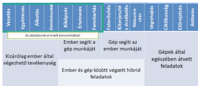
1. ábra A hiányzó közép