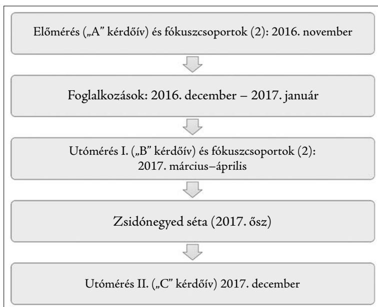
1. ábra: A hatásvizsgálat folyamata (2016–2017)

Az 1. ábrán összefoglaljuk a kutatás menetét, annak céljából, hogy folyamatában mutassuk meg, mely elemekből állt össze a csaknem 3 éves hatásvizsgálat.