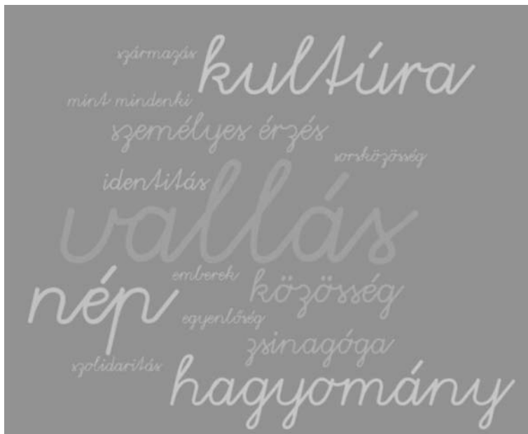
3. ábra: Aggregált szófelhő a háromszor vagy annál gyakrabban előforduló szavakból a foglalkozás utáni asszociációk alapján ( n = 238 ). Megjegyzés: Az ábra a MAXQDA 12 és a Word It Out szoftverekkel készült

Ha nem is lehet messzemenő következtetéseket levonni két osztály asszociációjából, azok egyrészt alapot adhatnak a kvantitatív eredményekkel való összevetéshez, másrészt jól illusztrálják, hogy osztályonként is eltérések vannak a foglalkozásokban és azok hatásában. Ez természetesen a diákokra is igaz: mindenkit másképp és más fog meg a 90 perc alatt elhangzottakból.