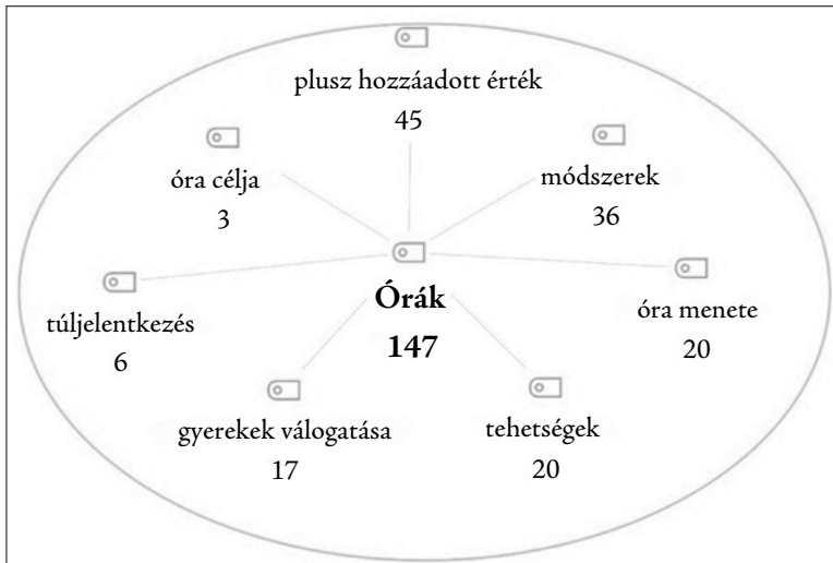
3. ábra: A Máltai Szimfónia program órái alkódjainak eloszlása

A közös zenekari játékhoz elengedhetetlen a másokra való odafigyelés, alkalmazkodás. A közösség érzése kapcsán mint egy nagy családra, úgy hivatkoznak a Szimfóniára. A rendszeres közös gyakorlások által megtanulják, hogy a befektetett energia megtérül és érdemes foglalkozni vele nemcsak a hangszerjáték, hanem az iskola és az élet egyéb területein is. Példaképeket kapnak a gyerekek, több roma mentor és zenetanár dolgozik ebben a rendszerben. Nagyon odafigyelnek a szeretetre és az elfogadásra a mentorok, zenetanárok, és erre óriási szükségük van a diákoknak, „pótapa, barát, lelki társ, segítő” a szemükben a zenetanár. Az utazások révén kinyílik számukra a világ. A táborokban, kirándulásokon ismerkedhetnek, így értékes kapcsolatokat kapnak más települések szimfóniás diákjai által. Fontos, hogy „lássák, hogy egy nagyobb hálónak a részei, és hogy megismerkednek egymással, tényleg barátságok szövődnek”.