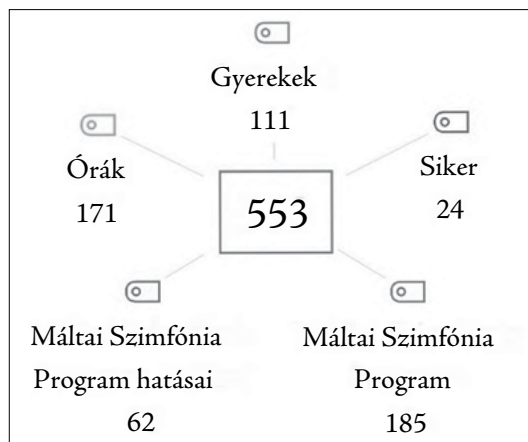
1. ábra: A főkédek eloszlása

A kódolás eredményeként összesen 553 kód és öt főkéde rajzolódott ki: Máltai Szimfónia Program, órák, gyerekek, Máltai Szimfónia Program hatásai, siker. Ezek eloszlását mutatja az 1. ábra. A leg-