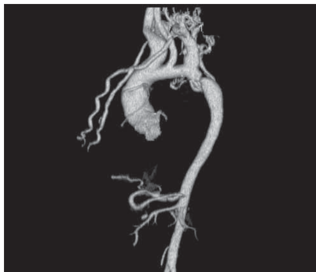
1. ábra | Coarctatio aortae képe angiográfias felvételen

Az akkor 69 éves férfi beteg kórelőzményében tonsillectomia, kétoldali inguinalis herniotomia, 18 éves kora óta ismert hypertonia, 1981-ben „lábön kihordott” myocardialis infarctus szerepel. 2004 áprilisában effort anginás panaszok miatt végzett coronarographia proximális bal elülső leszálló ág (LAD) stenosisát és gravis coarctatio aortae-t igazolt, amelyen a csúcsgradiens 90 Hgmm/s volt. 2004 júniusában elektív aorta-coronaria saphena bypass ad RDA (jobb leszálló ág) történt. 2006 novemberében non sustained kamrai tachycardia miatt észlelték, ismételt coronarographia során igazolt szignifikáns obtus marginalis (OM) stenosis miatt primer coronariaintervenciót (PCI), stentimplantációt végeztek. Az ekkor elvégzett echocardiographia enyhe diffúz hypokinesist, jelentős anterior hypokinesist, csökkent globális