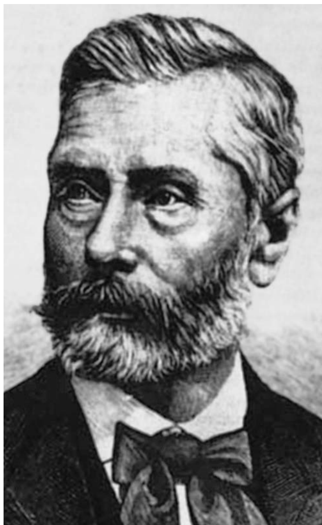
1. ábra Markusovszky Lajos (1815–1893)

meg, mint a New England Journal of Medicine, a Lancet, a Wiener Medizinische Wochenschrift, a Nederland Tijdschrift voor Geneskunde, s egyidős a British Medical Journal tudományos folyóirattal. A lap alapításának célja: Legyen magyar