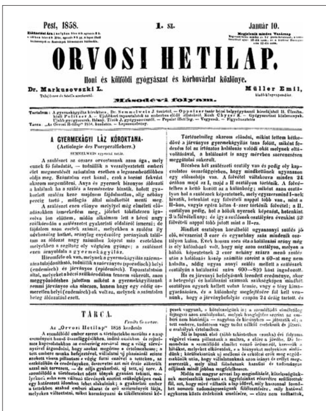
3. ábra Semmelweis Ignác közleménye a gyermekágyi lázról. Az Orvosi Hetilap második évfolyama, 1858

nyelvű, hetente megjelenő orvosi szakfolyóirat! Szolgáljon e lap szakmai orgánumként a hazai és a külföldi új gyógyászati eredmények ismertetésére és terjesztésére (2. ábra)!