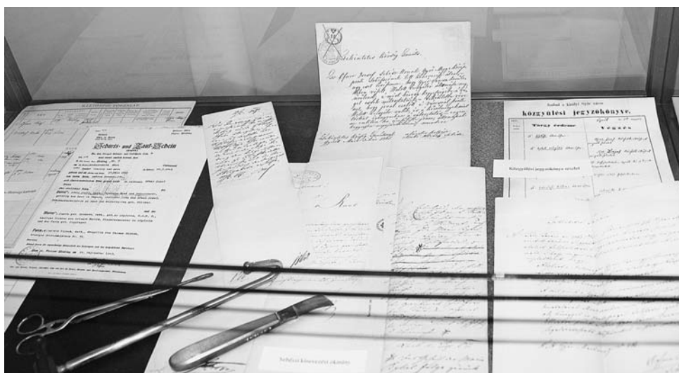
4. ábra Kiállításrészlet II.