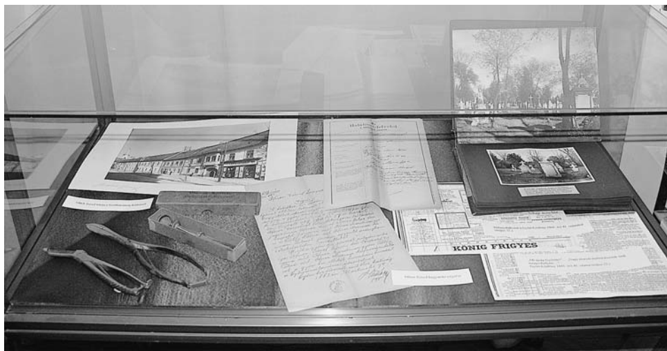
3. ábra Kiállításrészlet I.